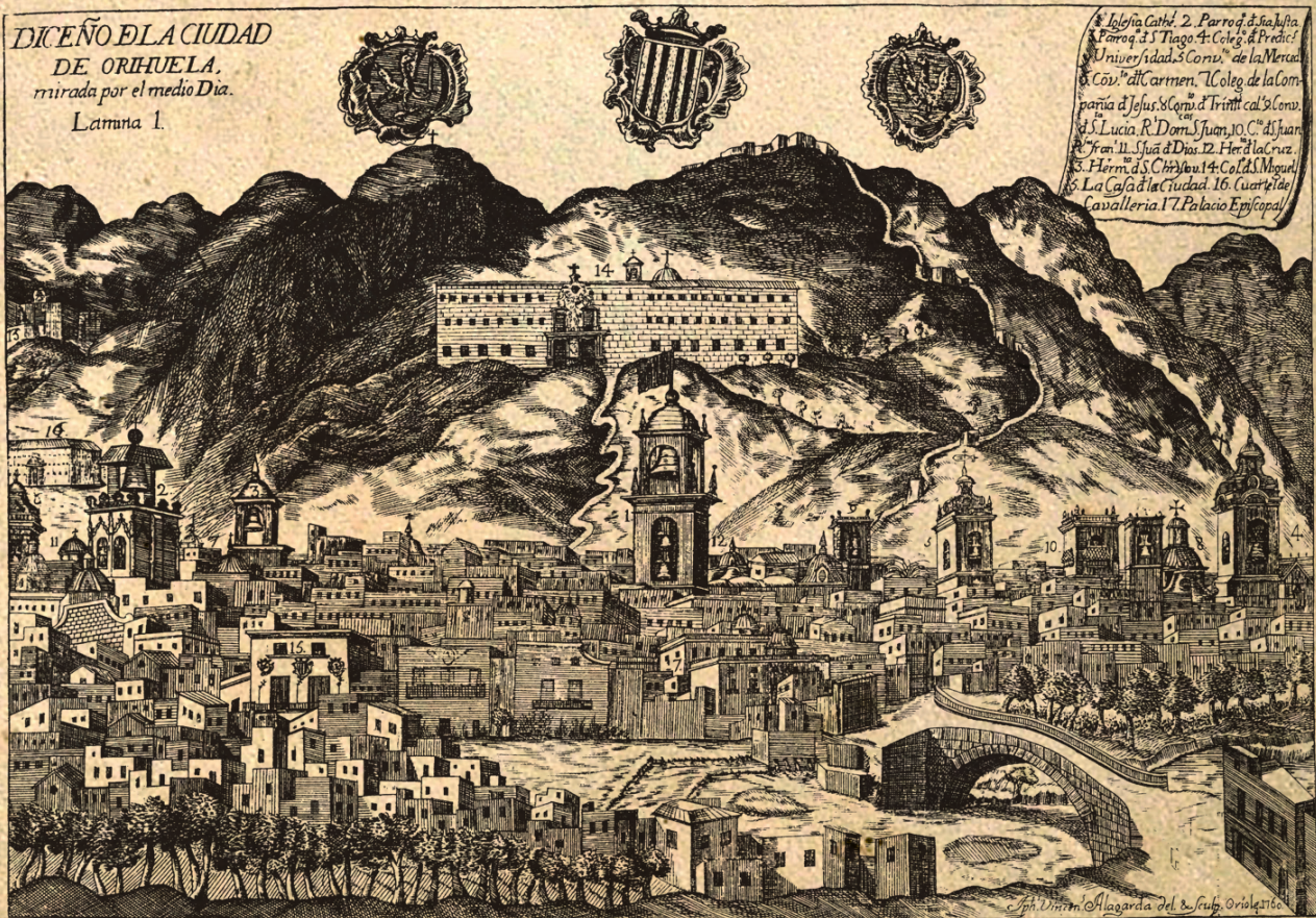
Grabado del siglo XVIII de José Vicente Alagarda donde se muestra la abundante presencia de iglesia y conventos en la morfología urbana de Orihuela (1760).

DICEÑO ELA CIUDAD DE ORIHUELA, mirada por el medio Día. Lamina 1.