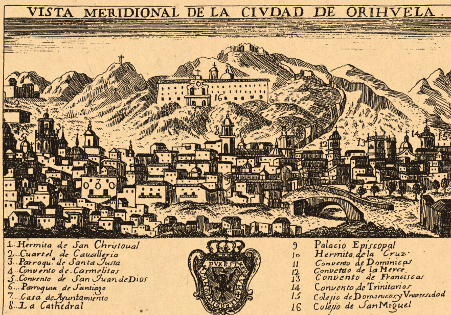
Vista de la ciudad barroca de Orihuela por Bernardo Espinalt y García (1784).

“Esta ermita tiene propia una lucida casa para la habitación del sacristán; y de ella sale (a costa de la congregación de Nuestra Señora del Pilar contra el Pecado Mortal) desde el año 1761, Jueves Santo en la tarde, una lucidísima procesión de la Pasión del Señor con los siguientes tabernáculos.