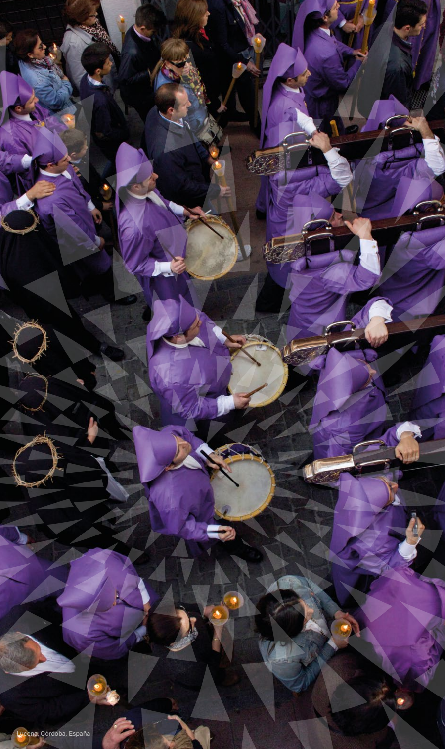
Lucena, Córdoba, España

En Europa, la Semana Santa y la Pascua se celebran con gran tradición e intensidad. Estas celebraciones de carácter religioso, tienen en algunos casos, raíces ancestrales.