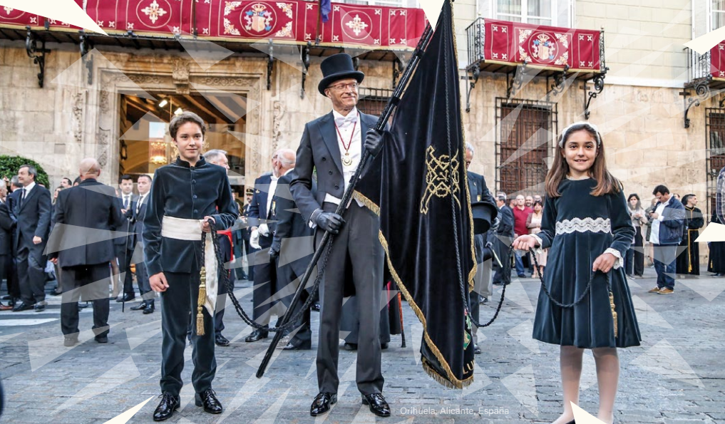
Orihuela, Alicante, España