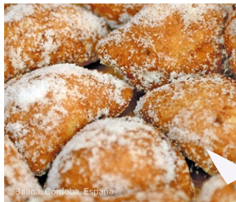
Baena, Córdoba, España

Una de las celebraciones más originales, reconocida por la UNESCO, tiene lugar en la pequeña localidad de Škofja Loka, en Eslovenia , donde se recrea una escena secular de la Pasión de Cristo en las calles y cuenta con la participación de toda la comunidad.