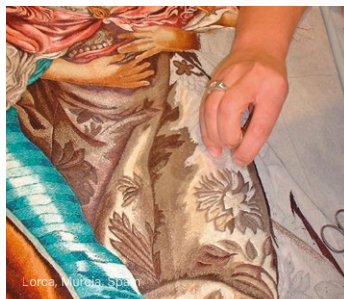
Lorca, Murcia, Spain

And how could we forget the city of Braga ( Portugal )? Braga is the seat of the main Portuguese Archdiocese and home to a singular liturgical rite, where the Holy Week is the main manifestation of its kind in Portugal.