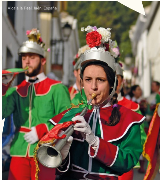
Alcalá la Real, Jaén, España

Alrededor de estos lugares fueron apareciendo corporaciones religiosas (cofradías y hermandades) que se hicieron responsables de la realización de manifestaciones de devoción y que fueron evolucionando a lo largo del tiempo, alcanzando su máxima expresión durante la Cuaresma y Semana Santa. Es, por esta razón, por la que se puede ver en Europa un espacio geográfico en el que conviven variadas manifestaciones culturales: maneras distintas que tienen las comunidades de vivir las tradiciones de Semana Santa y Pascua.