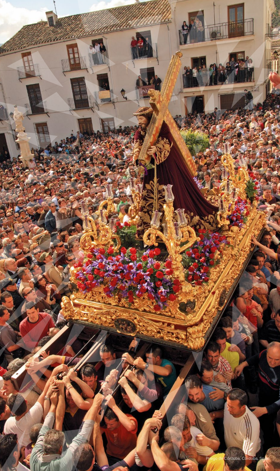
Priego de Córdoba, Córdoba, Spain

Europe is the place where the Holy Week and Easter are celebrated in the most traditional and passionate way. Religious in nature, these celebrations have ancestral roots in some cases.