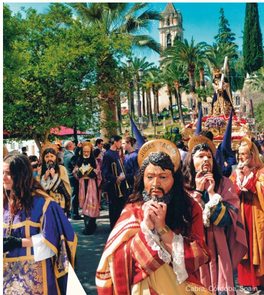
Cabra, Córdoba, Spain

Around these places, religious corporations were born (brotherhoods and sisterhoods), which were responsible for organising devotional manifestations that have evolved over time, and that take on a larger dimension during Lent and the Holy Week. For this very reason, it is possible to observe a geographical area where a number of cultural manifestations coexist in Europe: a diversity of ways for communities to experience the traditions of the Holy Week and Easter.